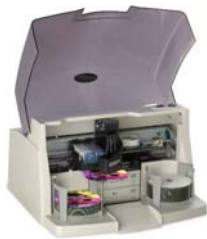
Robot de gravure Disc Publisher Pro