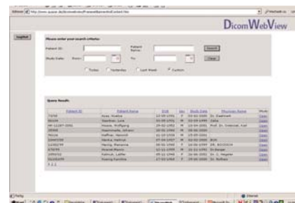
Maniement simplissime via Internet Explorer

Les données imagées de toutes les modalités d'imagerie clinique, par exemple CT, MR, US, CR, SC, XA, RF, NM (y compris multi-cadres) et beaucoup d'autres encore sont visualisées exactement comme des photos couleurs 24 bits (RGB).