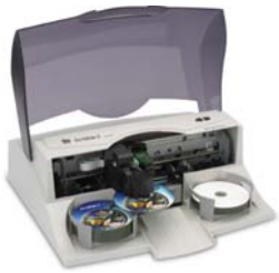
Robot de gravure Primera DP2