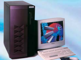
Serveur d'Entreprise Clusterisé, cartes-mères Bi-Xéon™ doublées disques Hot-Swap Ultra /320, Mono Pentium™ IV et Bi-Xéon™.