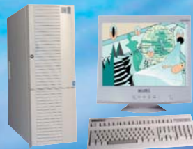
Grande Tour Mono Pentium™ IV et Bi-Xéon™.

Produits susceptibles de changement sans préavis