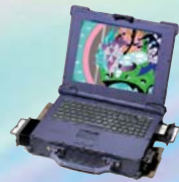
Notebook Renforcé Pentium™ III et IV.