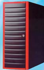
Tour de disques Hot-Swap.