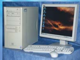
Moyenne Tour ATX Céléron™, Pentium™ IV ou bi-Xéon™.