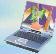
Notebook Multimédia Pentium™ IV Mobile.