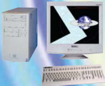
Mini Tour Micro ATX Céléron™ ou Pentium™ IV.