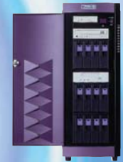
Serveur d'Entreprise disques Hot-Swap Ultra /320, Mono Pentium™ IV et Bi-Xéon™.