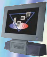
PC LCD intégré.