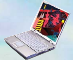
Notebook Multimédia Pentium™ IV.