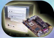
Cube Pentium™ IV très faible encombrement.